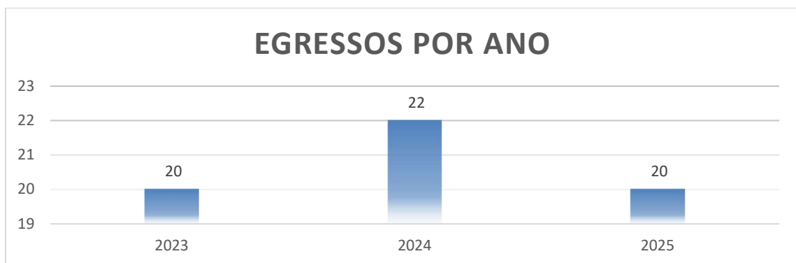
Figura 4 - Egressos (3 anos)